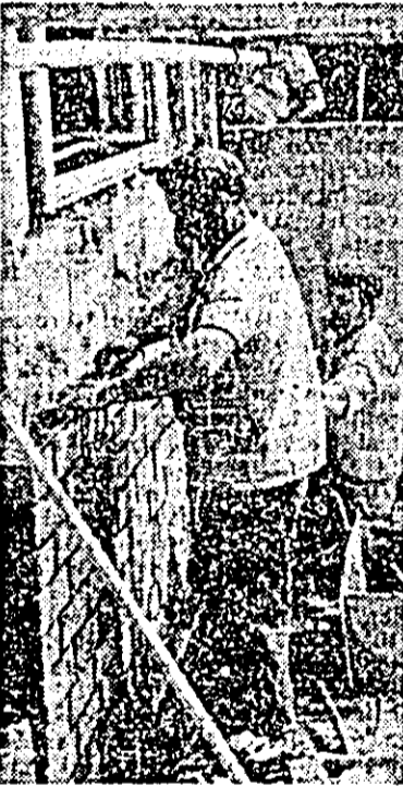
Zona de locuințe IV-C din cartierul Aurel Vlaicu: se lucrează intens la înisarea unui nou bloc.