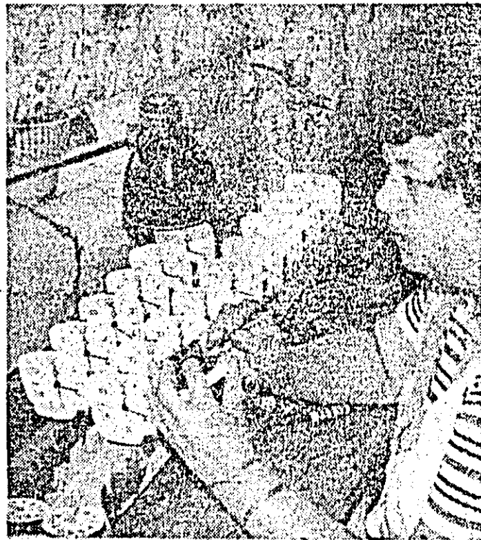
Montajarea Solia Roman este una dintre apreciatele frumuseți ale întrecerii socialiste de la „Victoria”.