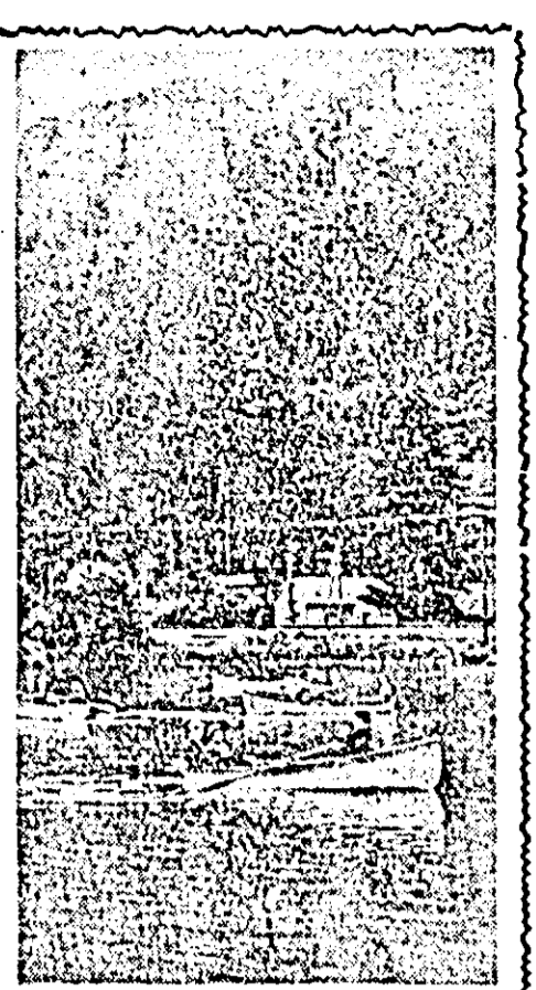
Au sosit zilele călduroase. Plăcerile odihnei sînt acum și mai mult gustate de oamenii muncii aflați în concediu în pitoreștile stațiuni climatice ale țării. Iată-ne în clișeu de față — la Tușnad-Băi. Vislul pe lac constituie și el una din plăcerile odihnei.

noile produse se află și acidul boric tehnic, uleiul de ricin deshidratat care înlocuiește cu succes uleiurile sicative, anhidrida meleci, naftonitrii metalici, 6 noi coloranți, 2 sortimente de anvelope pentru combine etc. La acestea se adaugă noi produse de mase plastice ca: ovore de baie, coșulețe pentru copii, jucării, mileuri, pelerine etc. Nu de mult în industria chimică au intrat în funcțiune o nouă instalație pentru producerea hetanafolului și o alta pentru anhidrida cronică.