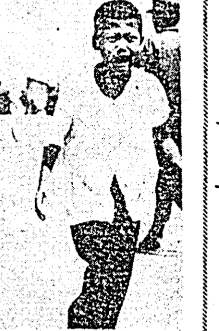
VIETNAMUL DE SUD: Copii din Bien Hoa, 18 mile nord-est de Saigon fugind, îngroziiți în timpul recentelor lupte desfășurate aici.

„O șuierătură interminabilă, o explozie scacă — Saigon, duminică 23 februarie. În strada Tu Do, Champ Elysees-ului saigonez, cițira trecătorii se opresc și se privesc în tăcere. O rachetă cade chiar în apropierea unui garaj, gău rindu-i acoperisul. Două, trei explozii. În baruri consumatorii s-au aruncat la pământ. La cinematograful „Rex” mulțimea cuprinsă de panică se îngrămădește la iesire, îngheșuind femeile, copiii. La hotelul „Continental” un european este trezit din somn de urletele vecinului: E bombar-