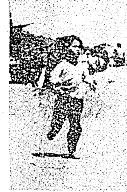
VIETNAMUL DE SUD: Copii din Bien Hoa, 18 mile nord-est de Saigon fugind, îngroziiți în timpul recentelor lupte desfășurate aici.

SAIGON 13 (Agerpres). — Peste 40 de baze și puncte strategice americano-saigoneze au fost atacate miercuri în cea de-a 19-a zi a ofensivei generale declanșate de forțele Frontului Național de Eliberare din Vietnamul de sud. Aeroportul Ban Me Thout, situat într-o zonă a platourilor înalte sud-vietnameze, a fost supus unei puternice canoane de mortiere în urma căreia 6 elicoptere americane au fost avariate la sol. În apropierea frontierei cambodgiene, trupe ale celei de-a 4-a divizii de infanterie a armatei americane au fost angajate timp de peste 12 ore