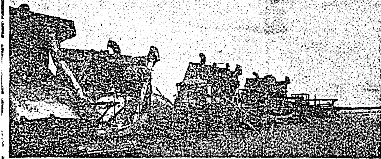
La cooperativa agricolă de producție Vârșand, combinele lucrează din plin.

În acest scop I.G.R.A. a solicitat Uzinei de reparații Arad prin adresa nr. 10.029 din 14 noiembrie 1967 anohor-debitării cantității de 600 kg tablă zincată la sectorul IV după orele de serviciu, urmînd ca plata manoperei să se efectueze de către I.G.R.A. T.A.P.L. Arad a transportat în sectorul Locotenent. IOAN ARDELEAN, din Miștea municipiului Arad (Cont. în pag. a II-a)