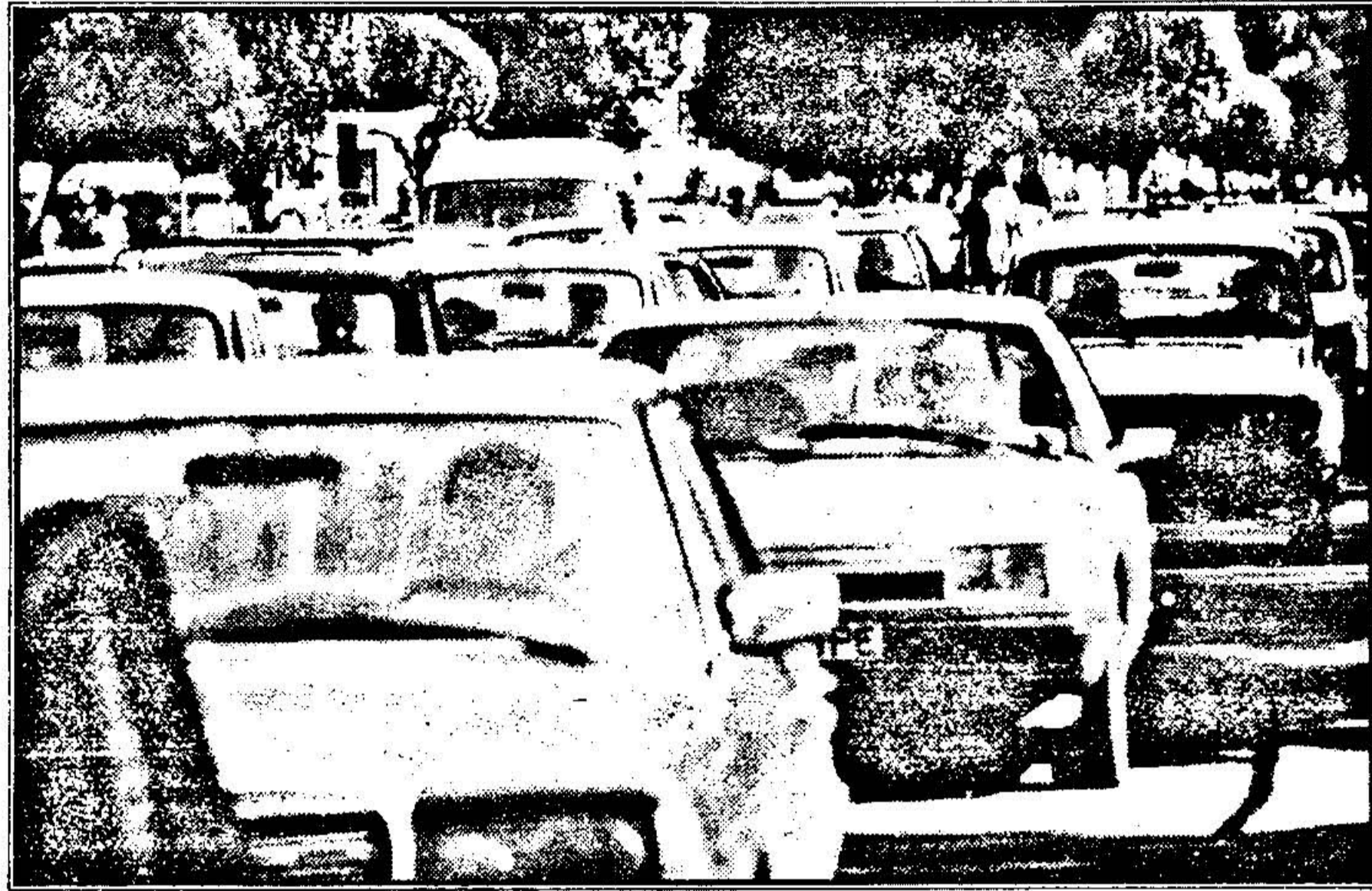
Ieri, în Arad, la o oră de vîrf: autoturismul— un avantaj sau un supliciu ?

Reduceri de impozite salariale Printr-o Ordonanță aprobată ieri de Guvern se instituie noi reglementări privind impozitarea veniturilor salariale. Astfel, pensia suplimentară și fondul de șomaj se vor scădea din baza de impozitare și se va reduce nivelul impozitelor în cazul salariilor cumulate. De asemenea, s-a acceptat legal „ideea fiscală” a existenței celui de al 13-lea salariu, a cărui impozitare se va face separat și care nu va fi cumulat cu salariul din ultima lună a anului. În premieră-casă DURREF Inventatorul Andrei Hododi a început, ieri dimineață, în spațiul ROMEXPO, construirea primei case modulare din DURREF. La ora 8,00, aproximativ 50 de muncitori, îmbrăcați în salopete roșii, galbene și albas-