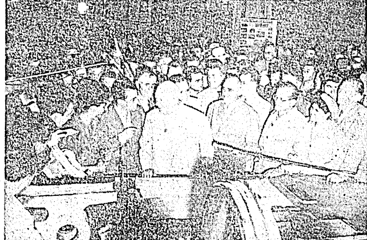
Vizita delegației de partid și guvernamentale a U.R.S.S. în frunte cu N. S. Hrușciov la uzinele „Grivița Roșie” din Capitală.