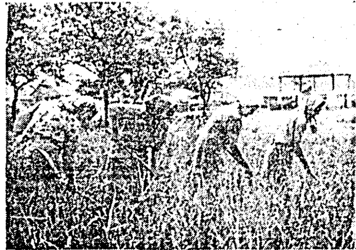
La Dorobanți întreținerea culturilor legumicole este o preocupare la ordinea zilei.