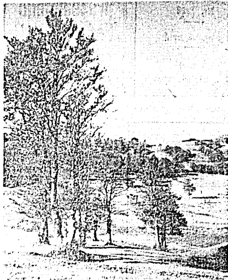
Toamnă pe Semenic