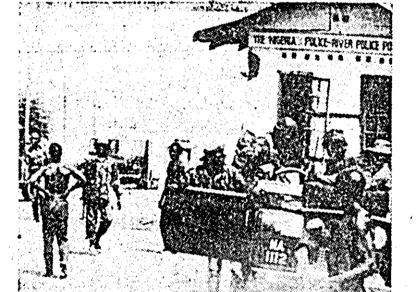
Soldaşi federali nigerieni la Asaba, pe malul de vest al fluviului Niger.