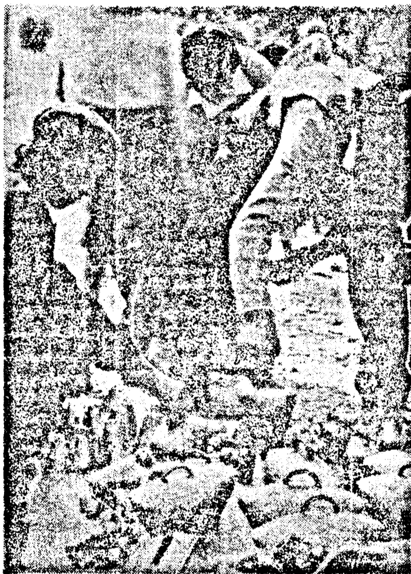
Talangi pentru vacile domnului Severin.