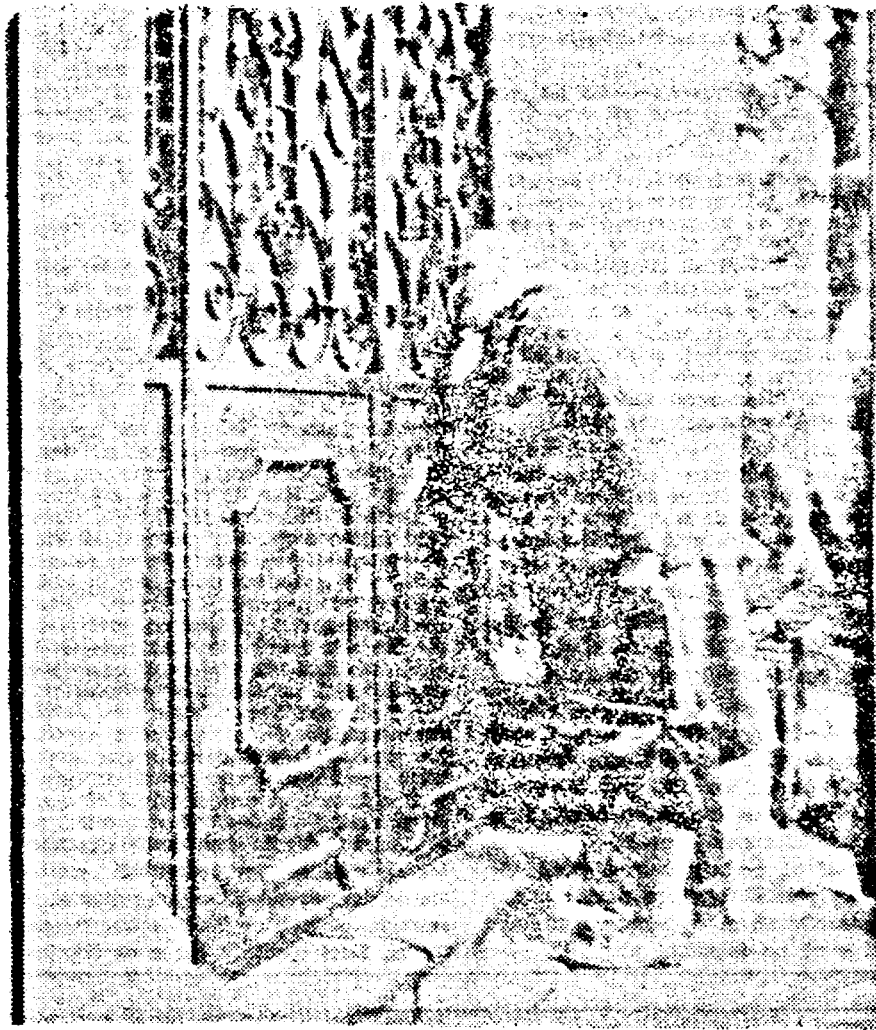
Privind spre Europa ... prin gaura cheii.

Deși s-au prezentat mai multe variante privind calea realizării privatizării — trecerea proprietății din patrimoniul statului (proprietatea socialistă) în patrimoniul persoanelor particulare (realizarea economiei de piață), guvernul a apelat la o comisie de specialiști străini plătind nici mai mult nici mai puțin pentru realizarea proiectului legii privatizării decît aproape „un milion de dolari”! De ce noi? Doar avem de unde. Visteria statului game de dolari! Unde ne sînt marii specialiști — tehnocrați din guvern, unicate de neînlocuit? Ce fac iluștrii noștri economiști din guvern? În fine proiectul legii privatizării realizat, ajunge spre discutare, în comisiile de specialitate ale parlamentului,