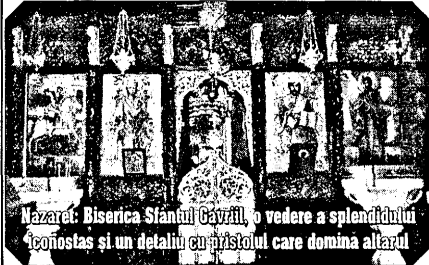
Nazaret: Biserica Sfântului Gavril, o vedere a splendidului iconostas și un detaliu cu pristolul care domina altarul

Isus s-a născut în Nazaret, o mică localitate din Galileea, și provenea din rândurile poporului. Iosif, tatăl lui adoptiv, și Maria, mama lui, erau oameni de condiție modestă, meșteșugari, trăind de pe urma muncii lor. Conform Bibliei, descendența lui Iosif urcă până la Solomon, David și Avraam. Populația Galileei era foarte amestecată, cuprinzând, pe lângă evrei, fenicieni, sirieni, arabi și greci. După Ernest Renan „este imposibil de ridicat aici problema rasei și să căutăm ce sânge a curs prin venele aceluia care a contribuit cel mai mult la ștergerea din omenire a deosebirilor de sânge”.