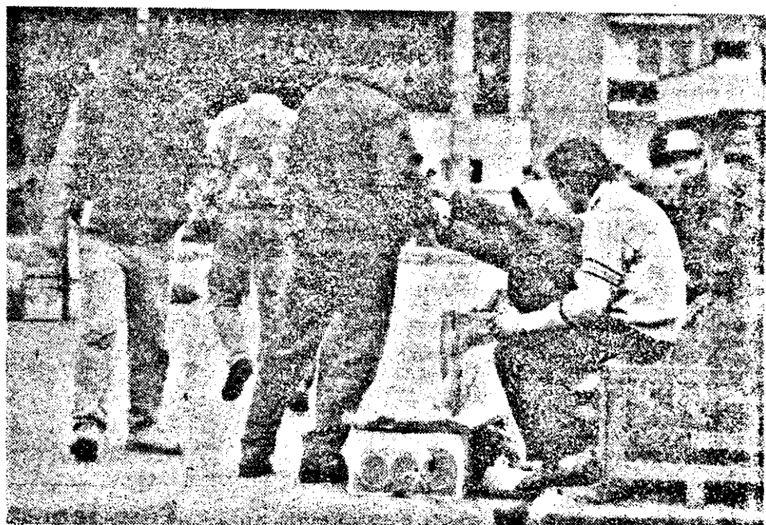
Pe calea privatizării: „la semința neamului”