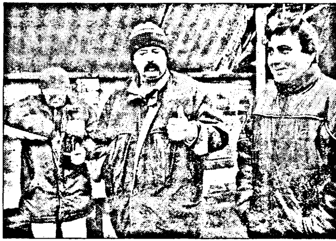
Oamenii considera că nu li se oferă nimic pentru banii pe care îi plătesc sub formă de taxe