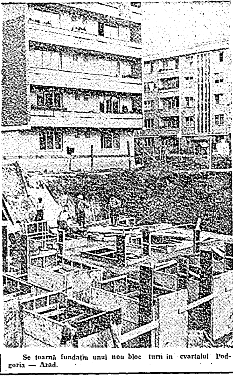
Se toamnă fundația unui nou bloc turn în cvartalul Podgoria — Arad.

La magazinul tip „B”, gestionar Mihai Vați, nu se găsesc unele mărfuri specifice sezonului — ce-lan, scorbăsoare — în vreme ce la „celălalt” magazin, gestionar