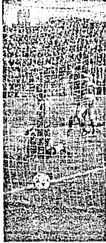
Satisfacție în tabăra gazdelor, deziluzie în cea a oaspeților: s-a înscris cel de-al treilea gol al „Strungului” în meciul său cu C.S.M. Reșița.

• Grupa sferturilor de finală a „Cupei cupelor” la polo pe apă, ale cărei întreceri s-au disputat la Sofia, a fost câștigată de formația Dinamo București, care a obținut trei victorii din tot atîtea meciuri: 17-10 cu De Robben (Olanda), 17-5 cu Charenton (Franța) și 13-8 cu ȚSKA Sofia. Pe locul doi, calificată, de asemenea, în semifinale, s-a situat De Robben.