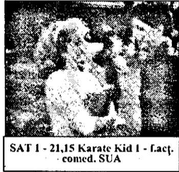
SAT 1 - 21,15 Karate Kid 1 - f. act. comed. SUA

6,28 Prezentarea programului 6,30 Viața satului 6,50 Jurnal regional 7,00 Magazin matinal. Din cuprins: stiri