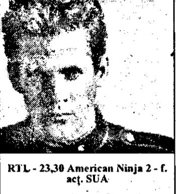
RTL - 23,30 American Ninja 2 - f. act. SUA

10,00 Golf mag. 11,00 Sportul în lume 12,00 Talkshow 13,00 Action 5