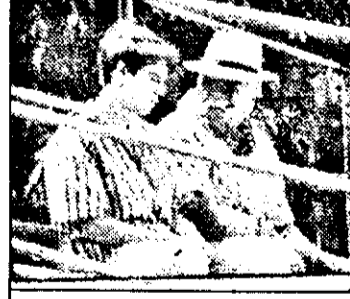
PRO 7 - 21,15 Cocoon 2 - Intoarcerea - f. fant. SUA 1988

7,05 Hart to Hart - s.am. - rel. 7,55 Des. anim. 12,10 Pantera roz - s.