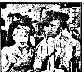
SAT 1 - 21,15 Mariandl - f. Austria

7,00 Reflectii 8,00 Vise africane 8,30 Bucătărie franceză 8,45 Curs de lb. franceză