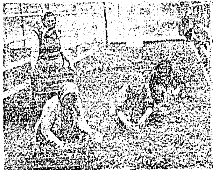
Pregătirea răsadului de tomate pentru plantare în cîmp, la Stațiunea de cercetare și producție leucimică Aradul Nou.