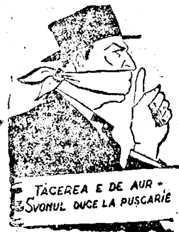
TĂCEREA E DE AUR ȘI SVONUL DUCE LA PUȘCĂRIE