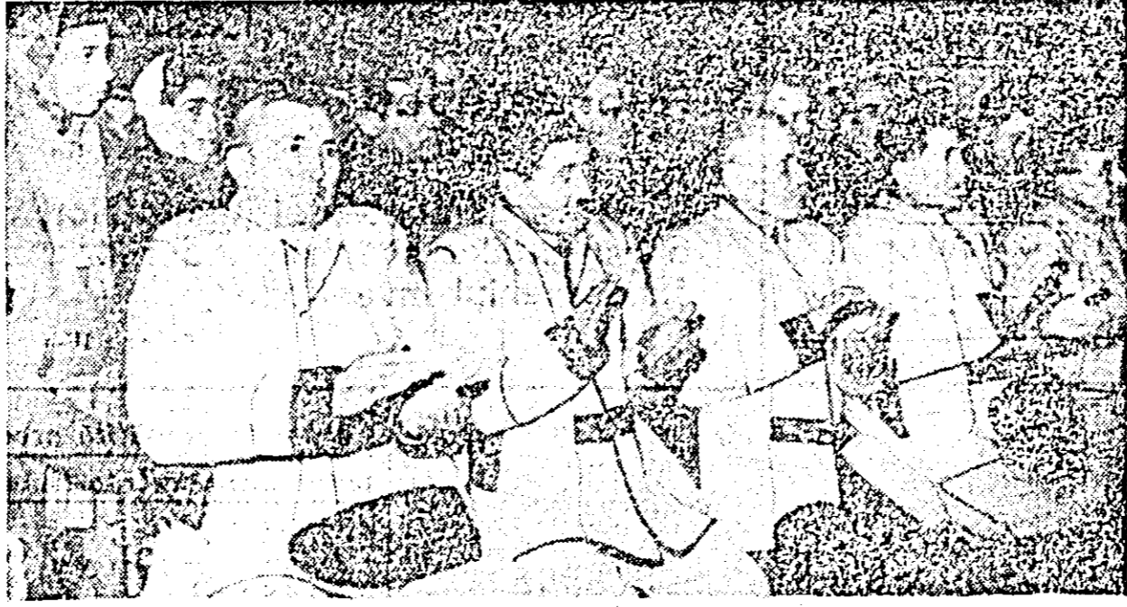
Printre spectatorii prezenți la manifestarea cultural-artistică, desfășurată duminică la Macea se văd — în prim plan — citiva bătrîni, pensionari C.A.P., îmbrăcați în frumoase costume românești.

Cînd acele cașornicului se apropie de ora prînzului programul sa sfîrșit. Sătenii pornesc spre case, satisfăcuți de varietatea și conținutul acestei manifestări artistice prilejuită de sărbătorirea Unirii Principate-