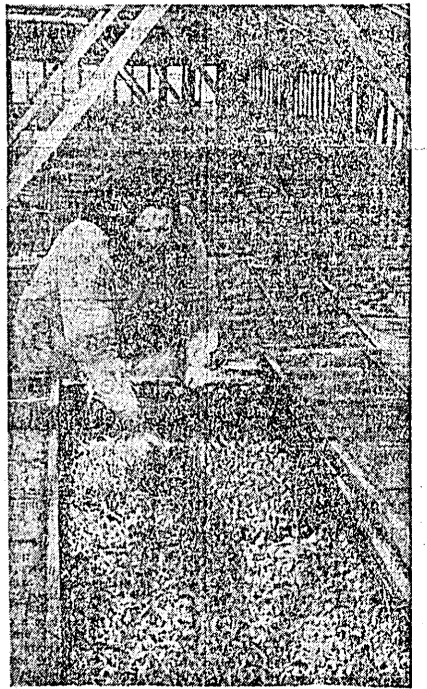
În aceste zile, legumicultorii lucrează din plin pentru a obține răsaduri de bună calitate pe care să le planteze cît mai timpuriu la locul definitiv de producție. O acțiune importantă este întreținerea răsadurilor.

Toate acestea vorbesc despre condițiile minunate de refacere a sănătății, create prin grîja partidului nostru, la care își aduc o contribuție deosebită și cadrele medicale din spital. GHEORGHE ȘICLOVAN, str. Eminescu nr. 46