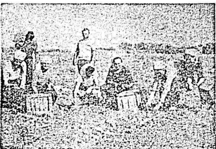
C.A.P. Felna. Se lucrează de zor și la sortatul cartofilor de toamnă.