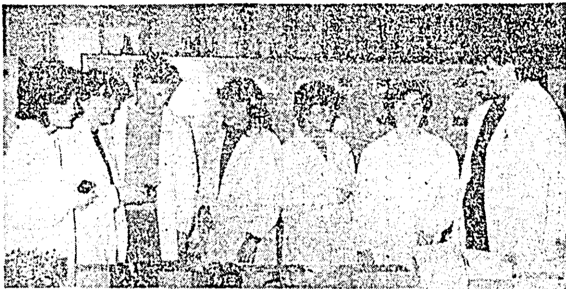
Tinerii din imagine lucrează într-o unitate în care colectivul de muncă are media de vîrstă sub 21 de ani — Întreprinderea de orologerie industrială — ea însăși una dintre cele mai „tinere“ din municipiu. Produsele realizate aici sînt apreciate de beneficiari, prindînd competență profesională și înaltă răspundere în muncă a acestui tînr colectiv.