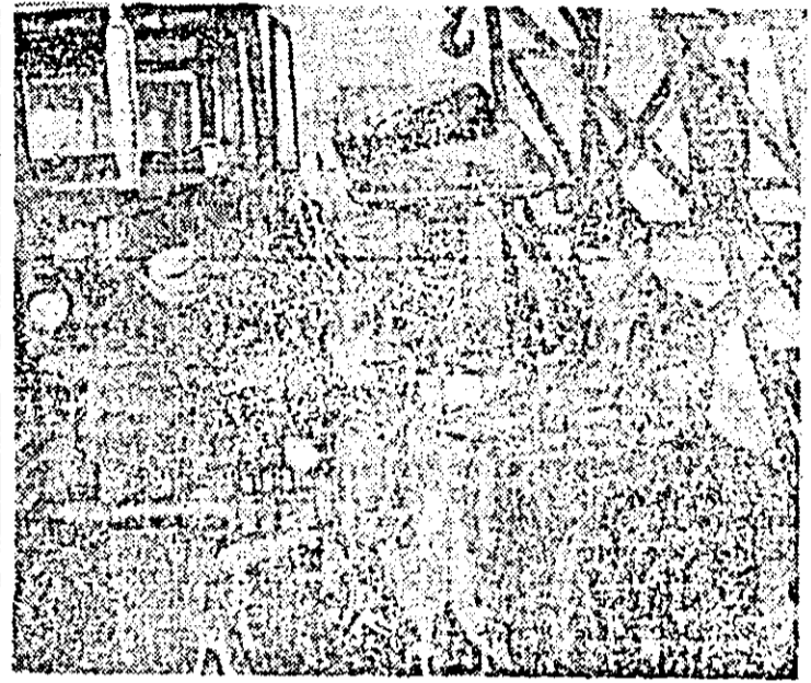
La S.M.A. Felnac se urgentizează finalizarea reparării utilajelor agricole.