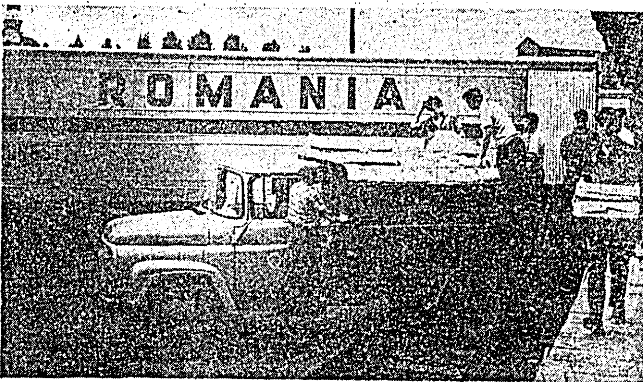
I.P.V.I.L.F. Arad — punctul de export gară. Un nou lot de roși destinat beneficiarilor externi se încarcă în vagoane.