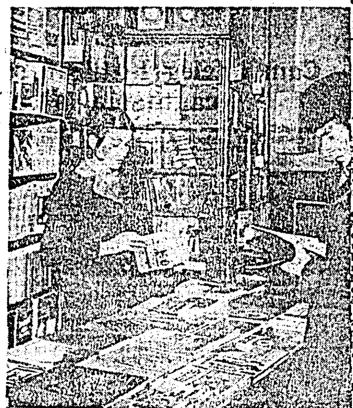
În aceste zile de început de an, librăria „Ioan Slavici” Arad pune la dispoziția iubitorilor de carte numeroase noi cărți aparute în principalele edituri din Capitală și din țară. În prim plan: un aspect al standului de beletristică din librărie.