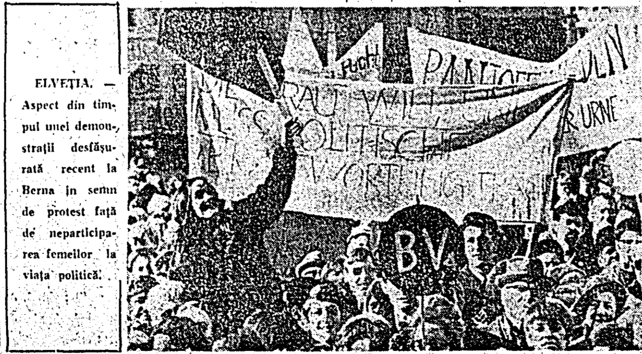
ELVEȚIA. — Aspect din timpul unei demonstrații desfășurate recent la Berna în semn de protest față de neparticiparea femeilor la viața politică.