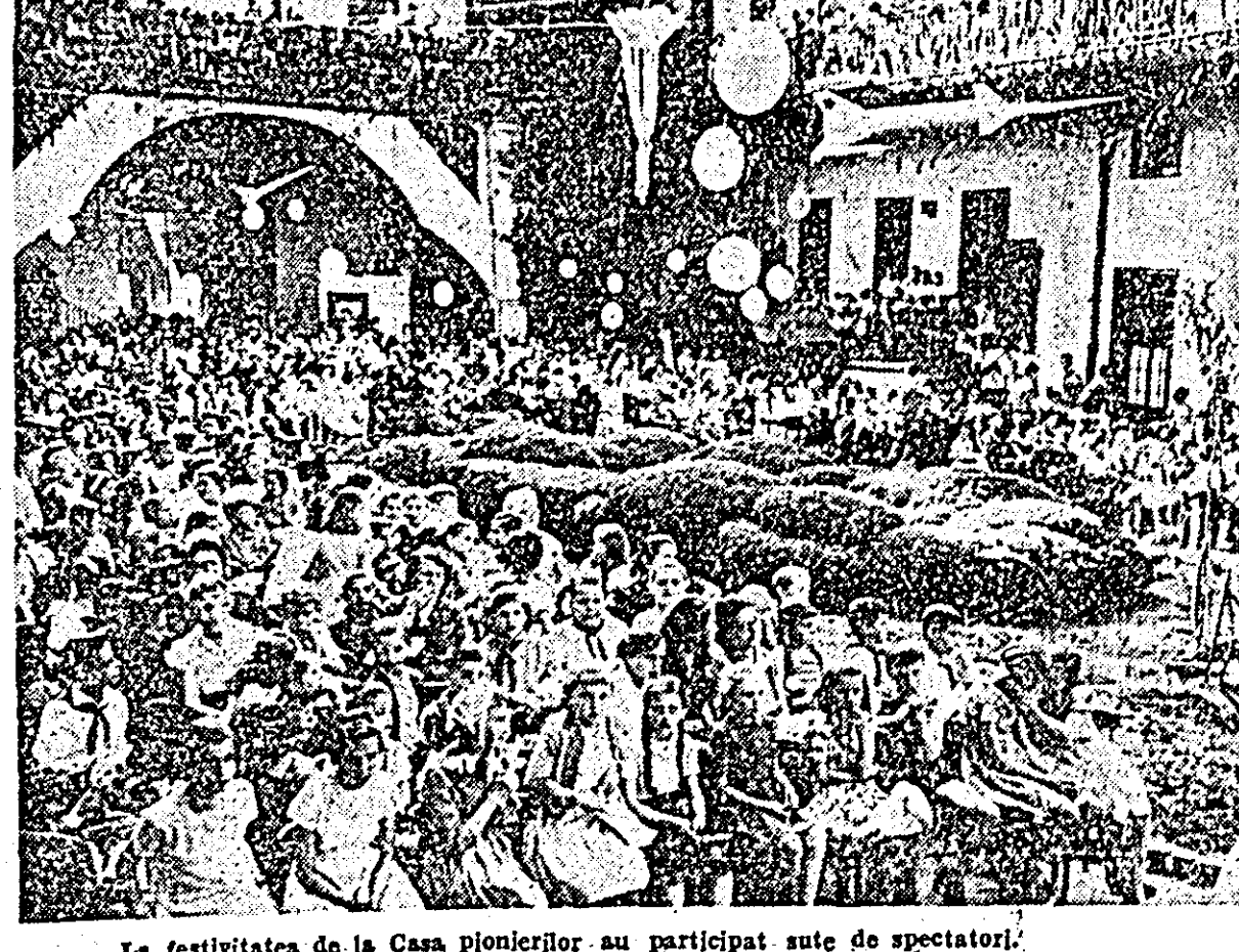
La festivitatea de la Casa pionierilor au participat sute de spectatori.

Curs de inițiere la motociclism De curînd, pe lângă asociația „Motorul” de la Uzina de reparății a luat ființă un curs de inițiere la motociclism. Cursul este frecventat de un număr de 40 muncitori din diferite întreprinderi din orașul nostru. Într-un termen relativ scurt ei au reușit să acumuleze o serie de cunoștințe practice și teoretice. Peste cîteva zile va începe și al doilea curs de inițiere la motociclism. (PETRU POPOVICI, coresp.)