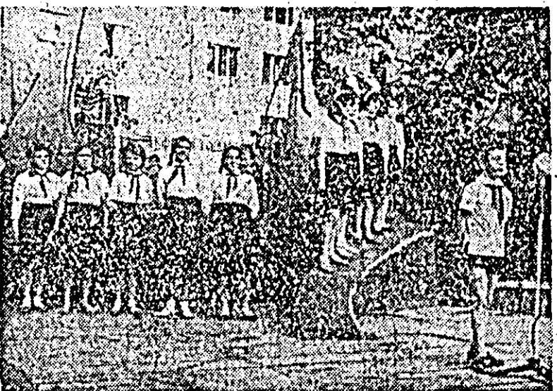
Brigada artistică de agitație a Casei pionierilor s-a bucurat de o binecîntată apreciere.

cipat la această sărbătoare. Va stăruit mult în mîntea lor farmecul acestui zile. Și pentru copilăria lor fericită, pentru zilele minunate pe care le trăiesc, cele mai tinere vîdăstare ale patriei aduc mulțumiri partidului, care le poartă atîta grijă.