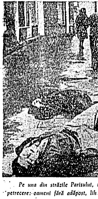
Pe una din străzile Parisului, nu departe de vestitele „localități” de petrecere: oameni fără adăpost, lilișiți de foamă.

La mina nr. 54 a orașului Bakovo-Antrații (Donbas) a avut loc experimentarea cu succes a unui nou aparat care asigură controlul automat al mișcării combinației miniere. Aparatul a fost construit pe bază de izotopi radioactivi. În prezent se lucrează la construirea unor aparate asemănătoare pentru automatizarea forării puțurilor miniere de extracție și a sortării mecanice a rocilor.