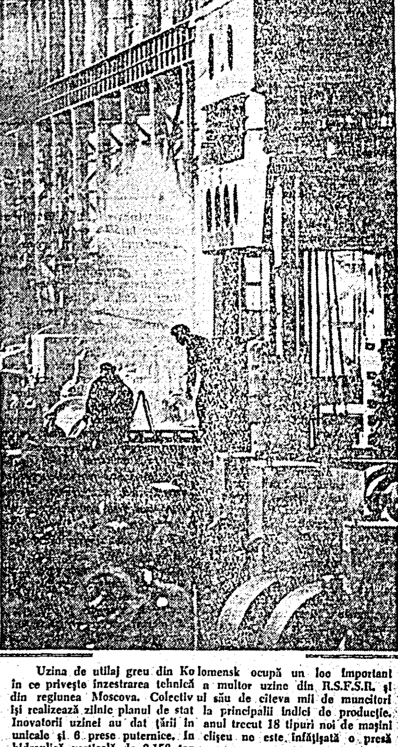
Uzina de utilaj greu din Kolumensk ocupă un loc important în ce privește înzestrarea tehnică a multor uzine din U.R.S.S.R. și din regiunea Moscova. Colectivul său de cîteva mii de muncitori își realizează zilnic planul de stat la principalii indicatori de producție. Inovatorii uzinei au dat țării în anul trecut 18 tipuri noi de mașini unicele și 6 prese puternice. În cișcu nu este înălțată o presă hidrolică verticală de 3.150 ton.

Pe malul Mării artisticele Tașkent, la 34 kilometri spre sud de capitala Uzbekistanului, a început construirea orașului Cighirik — sate-