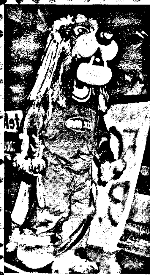
Simpaticul leu, mascota BC ICIM Arad, la prima apariție pe un teren de baschet