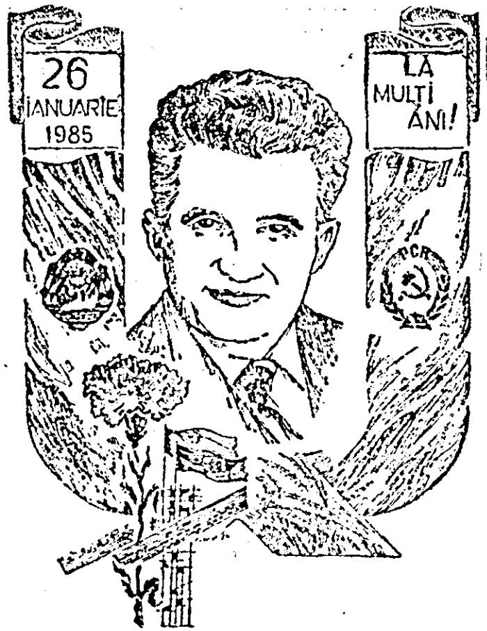
Grafică de LUCIAN COCIUBA