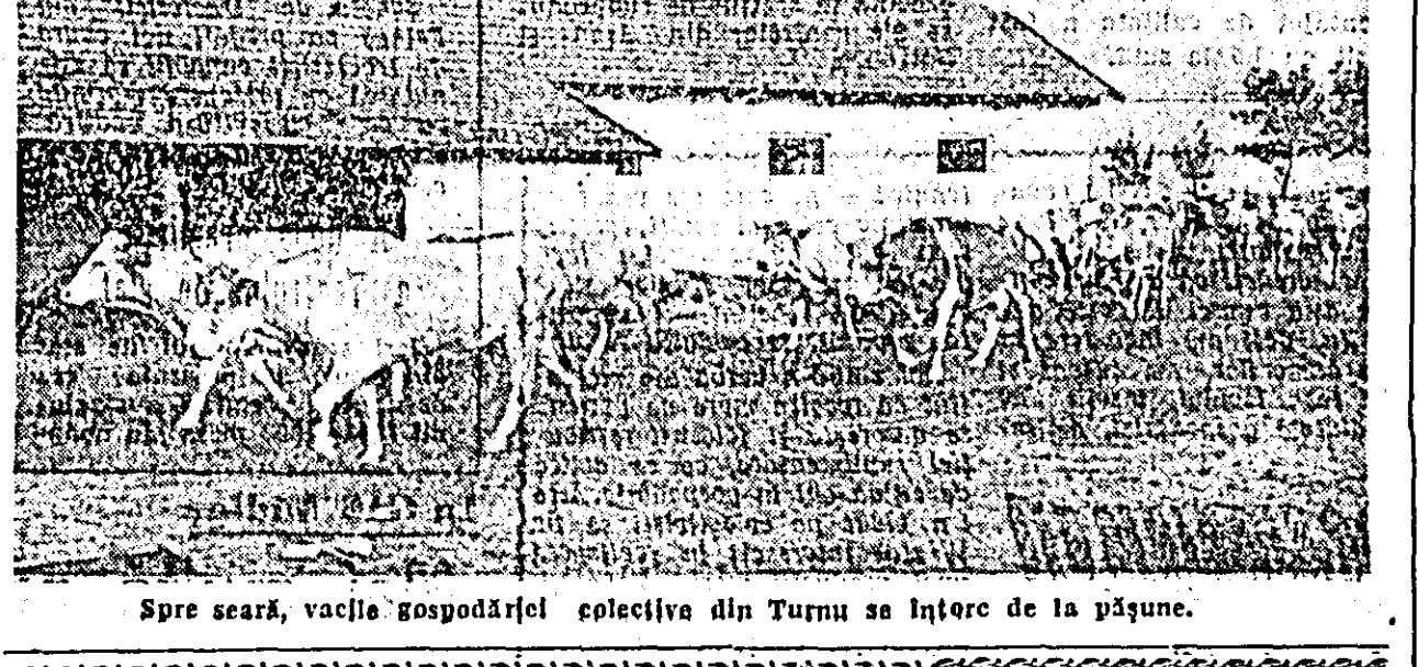
Spre seară, vacile gospodăriei colective din Turnu se întorc de la pășune.

fondurile alocate în acest scop. Se cere în primul rînd din partea brigadierilor, a tractoriștilor să-și organizeze mal bine munca, să realizeze aceste lucrări la un preț cît mai scăzut, evitînd lucrări în plus, nejustificate, care nu numai că nu duc la creșterea producției, dar înouă și prețul de cost. În sectorul zootehnic va trebui să existe mal multă preocupare pentru folosirea rațională a furajelor, care să fie administrate animalelor după producția pe care o dau. Conducerea gospodăriei, împreună cu organizația de partid, vor trebui să analizeze temeinic toate cauzele ce au dus la încălcarea prețului de cost și să ia astfel de măsuri, încît să se obțină o producție sporită la toate produsele, la un preț de cost cît mai scăzut.