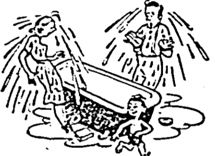
(După revista "Ogoniok")