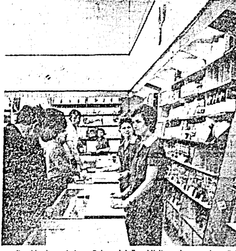
Deschis de curînd pe Bulevardul Republicii, noul magazin „Orizont” oferă o bogată gamă de produse.