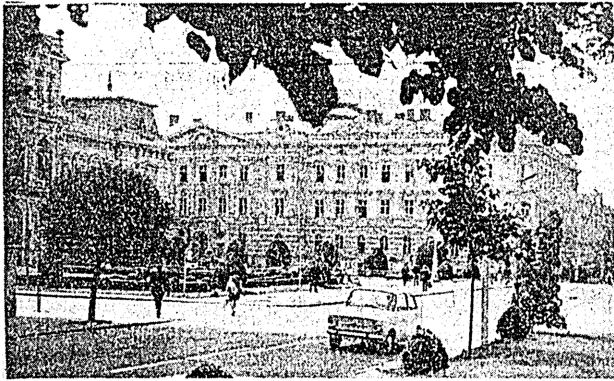
În frumosul centru civic al Aradului.