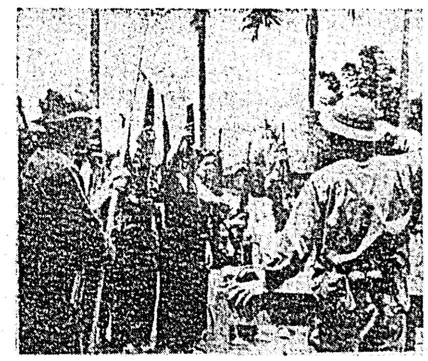
VIETNAMUL DE SUD. — După eliberarea regiunii Quang Tri, populația eliberată entuziasmată, a constituit noi unități de luptă alături de ostășii Armatei de Eliberare. IN FOTOGRAFIE: Constituirea unei noi unități de luptă a Armatei de Eliberare.

Delegația primarilor români, alături în Statele Unite la invitația Organizației Naționale a Primarilor Americani, a vizitat orașul Lincoln din statul Nebraska, clădirea Congresului, principalele puncte de interes economic, comercial și turistic, precum și o fermă agricolă din apropierea orașului. Delegația primarilor români a sosit joi seara la Detroit, statul Michigan.