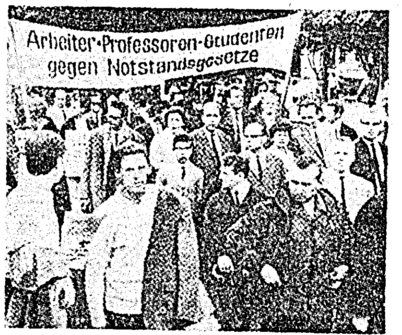
R. F. a Germaniei. În timpul unei recente demonstrații a locuitorilor din Bonn împotriva legilor excepționale.

HAVANA 19 (Agerpres) — În Piața Revoluției „Jose Marti” din Havana, a avut loc miercuri seara un miting de doliu închinat memoriei lui Ernesto Che Guevara, căzut eroic în lupta revoluționară. Piața era dominată de portretul lui Guevara încadrat de drapelul național cuban. La tribună au luat cuvîntul membrii Comitetului Central al Partidului Comunist din Cuba și al guvernului revoluționar. În uriașă plăc de aflu sute de mii de muncitori, țărani, soldați, studenți și elevi veniți din toate colțurile țării. Poetul cuban Nicolas Guillen a recitat un poem pe care l-a închinat memoriei lui Guevara. A luat apoi cuvîntul Fidel Castro, care a evocat viața și activitatea lui Ernesto Guevara. El a subliniat că Guevara a fost un conducător militar capabil, un om de acțiune și totodată un gânditor profund, înzestrat cu o mare inteligență și cultură. În el se îmbinau toate calitățile revoluționare: sacrificiul de sine, cinstea, modestia, voința de neclintire, capacitatea de a munci, dorința de a-și perfecționa cunoștințele, preocuparea față de soarta popoarelor. În încheiere, Fidel Castro a subliniat că Guevara și-a vărsat sîngele pentru cauza popoarelor latino-americane și de aceea figura lui luminosoasă va rămîne neștearsă în amintirea tuturor locuitorilor din țările Americii Latine.