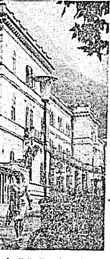
La Băile Herculane.

În dorința de a asigura schimbul de mline a gimnasticii, asociația sportivă Vagonul a organizat un nou curs de inițiere în această frumoasă disciplină sportivă.