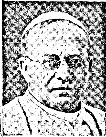
XI. PIUS PÁPA

órán át maradt a pápa betegágyánál, de arról nincs még hír, vajon a pápát a halotti szentségben részesítették-e, vagy sem.