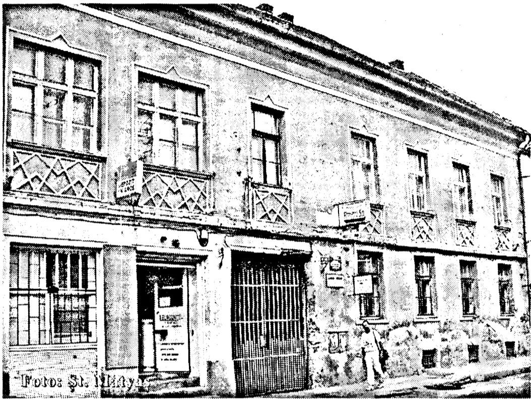
Viitorul sediu al UDMR va fi gata până de Crăciun