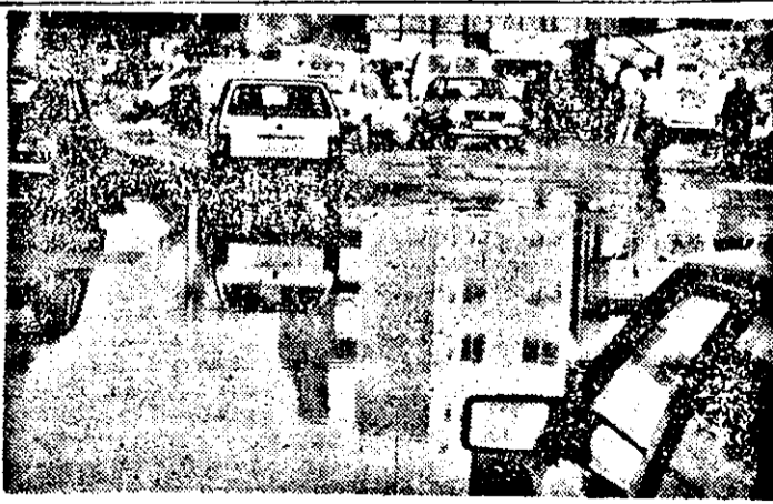
Alo, Primăria! Dacă se aude, să se si vadă apa care a invadat zona stației PECO din Piața Mihai Viteazul.