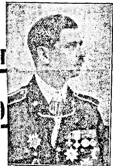
M. S. Regele Carol II-lea

ozașilor? Nu se cedau pădurele Statului pentru un pachet de aur? Nu se s'ergeau datoriile simple operațiuni aritmetice mentare scrise cu erida pe țara pentru jocul sau învâța'ul școlii?