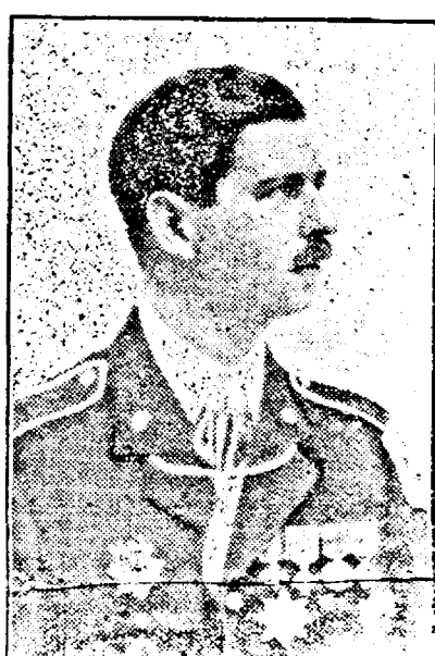
M. S. Regele Carol II.

„Manchester guardian“ închină în numărul său de Luni dimineață, un articol personalității M. S. Regelui Carol II și stradanților Sale, încununată de succes, făcute pentru redresarea internă a țării Sale cât și pentru a asigura României peste hotare o situație corespun-