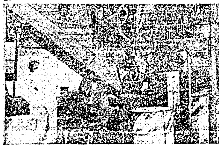
Cînd nu se scoală de dimineață, alimentează strîna combină...

— Încă n-am început recoltatul că înții adunăm pe-