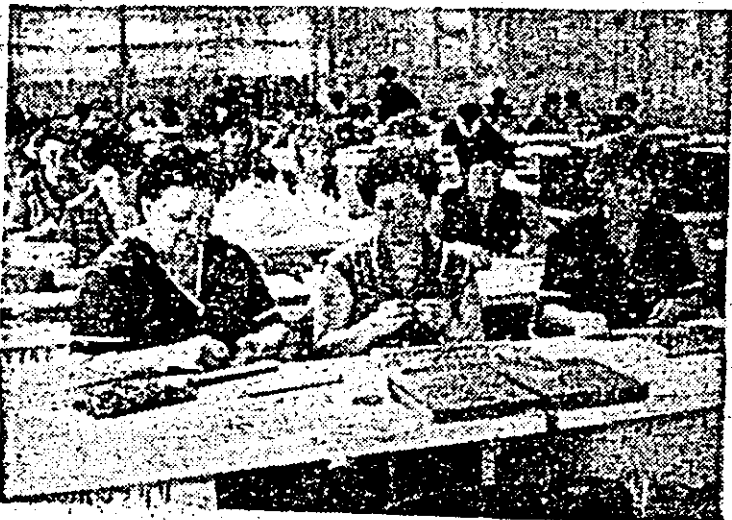
Întreprinderea „Arădeanca”. Aspect de muncă în atelierul emilare, colectiv fruntaș în întrecerea socialistă.