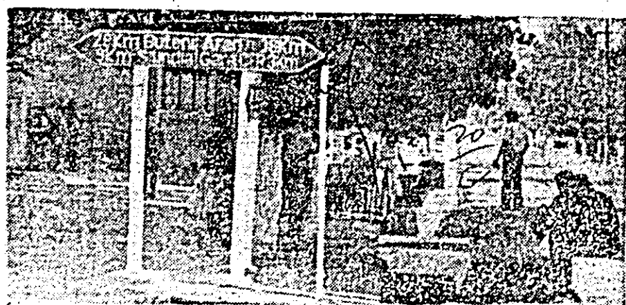
În timp ce pe ogoarele tîrnovene campania de toamnă și-a „intrat în drepturi”, necesitînd participarea întregii suflări a comunei la buna desfășurare a lucrărilor agricole de sezon, iată că totuși obiectivul aparatului fotografic a surprins și un aspect contrastant în această privință — un grup de cetățeni, în plin centrul comunei, așteptînd poate... intervenția fermă a Consiliului popular comunal în antrenarea lor la treburile campaniei.