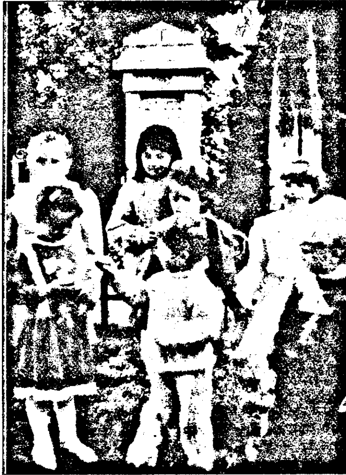
Care ou o fi mai tare? Al meu sau al tău?

Victima se afla sub influența alcoolului.