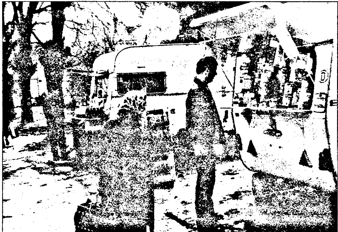
Imaginația și inițiativa comercianților privați pare să nu cunoască limite în ce privește folosirea rulotelor auto. Am avut langoșerii - rulotă, birturi - rulotă, acum avem și alimentare - rulotă. Ce ne-am mai putea dori?