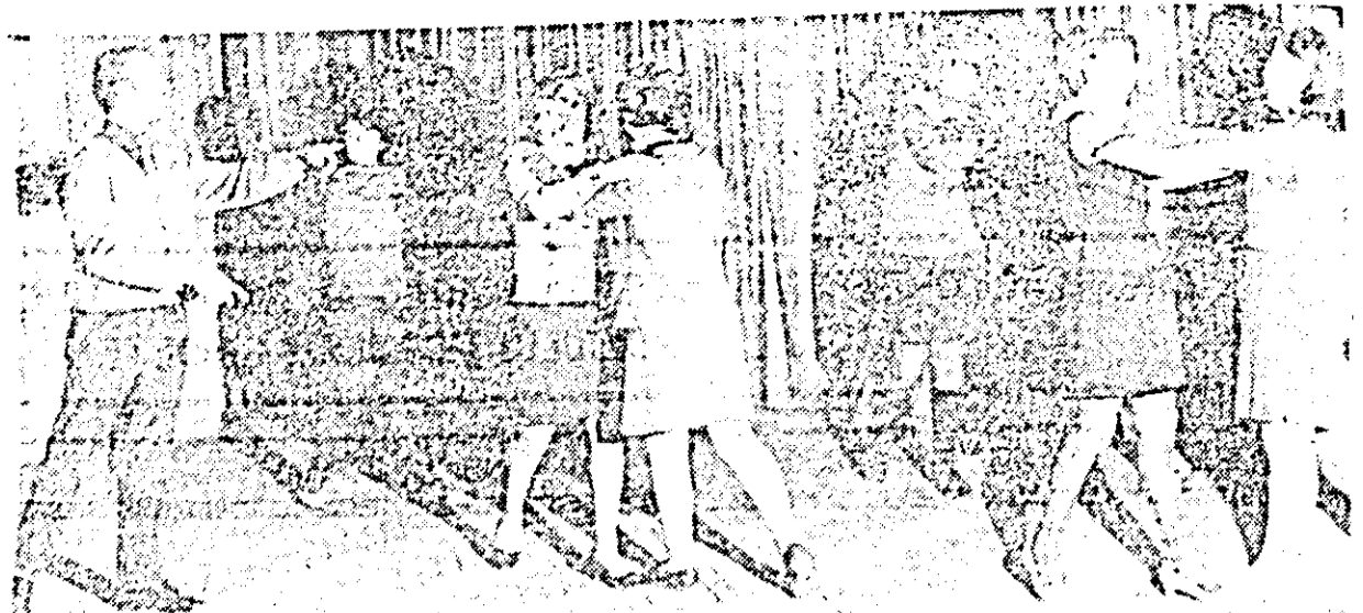
Echipa de dansuri a uzinei la repetiție.

Ritmul activității cultural-educative de masă într-o mare uzină, cum sînt uzinele textile „30 Decembrie”, are însăși ritmul și trepidația vieții ei. Ea presupune o integrare competentă și afectivă în munca ei cotidiană, o înaltă atitudine etică față de muncă, care să fie transmisă nemijlocit beneficiarilor ei. Clubul acestei mari întreprinderi răspunde oare acestui major deziderat? Consemnăm realitățile de azi, realitățile contemporane din viața culturală a acestei uzine, ce permanente trebuie să fie în pas cu vremea, continuu ancorată în actualitate.