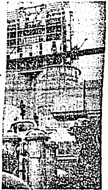
Constructorii Combinatului chimic acordă multă atenție calității lucrărilor de montaj.