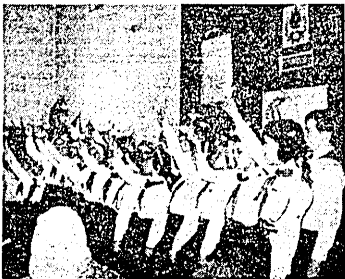
Purtătorii cravatelor roşii cu tricolor de la Liceul G. Coşbuc din Nădlac, într-un spectacol omagial dedicat zilei de 8 Martie.