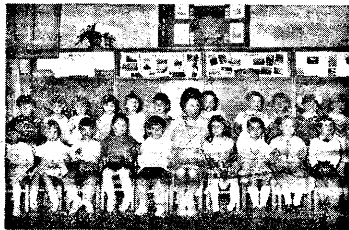
După un reușit spectacol în fața părinților „artiștii” din grupa mijlocie a Grădiniței de copii a IVA au ținut să se fotografieze împreună.