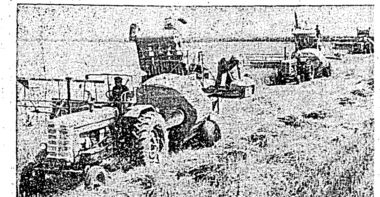
Grîndina care a căzut zilele trecute a diminuat în mare măsură posibilitatea operatorilor din Mică-laca de a desfășura intens scerșul grîului. Tocmai în asemenea condiții s-a conștientizat mai pregnant hărnicia și pricepera lor de a ieși cu bine din acest impas.