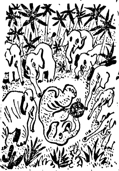
A órkuszli elefánt hazatér családjá körébe...

Alfonz spanyol exkirály részvétét fejezte ki a panarandai löporrobbanás felett. Onfából jelentik: XIII. Alfonz spanyol exkirály részvététáviratot intézett Franco tábornokhoz a panarandai löporrobbanása következtében beállott katasztrófával kapcsolatban. Egyben értesítette Franco tábornokot, hogy 10 ezer pezetát adományozott a robbanás következtében elpusztult emberek hozzátartozóinak.