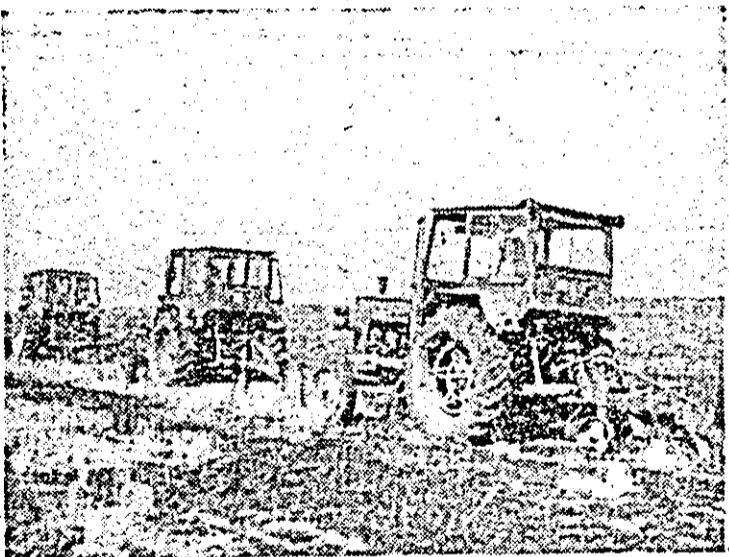
Brazdă nouă pentru viitoarele recolte..