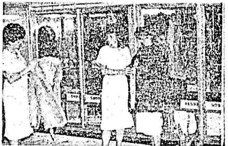
Cu gîndul la iarnă... Aspect din magazinul de confecții din blană și piele din Arad, B-dul Republicii nr. 23.

A.S. Loto Pronosport anunță fragera „Loto 2” din 22 septembrie a.c., singura din această lună. Se atribuie autoturism „Dacia 1300” și importante sume în numerar. Vinzarea biletelor la toate agențiile loto din municipiu și județ pînă sîmbătă, 21 septembrie a.c., inclusiv.