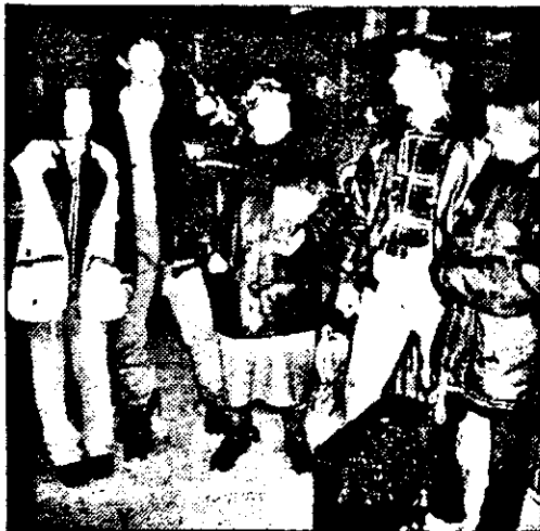
„Ți-o las, mamă, să ai grijă de ea ...“

ce mai departe. Efectiv, toată viața îți trece prin fața ochilor. E momentul în care te încercă regretul că n-ai făcut mai mult, „ca să te distrezi”.