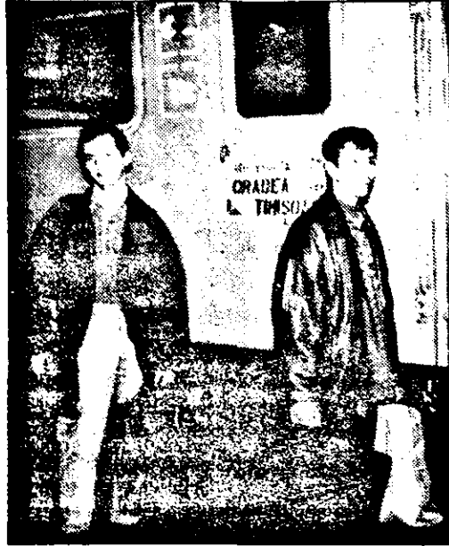
„Trenule, mașină mică, unde-i duci pe Ionică? ...“

Cu fiecare minut ce trece, Aradul e din ce în