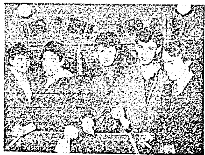
Moment de mare încălzătură emoțională: linetti de la Liceul Industrial nr. 7 pentru prima dată în fața urnelor.