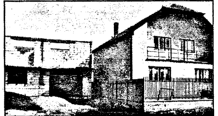
Romii de la Nădlac și-a zis că o „căsuță” în plus nu strică niciodată.

săracul, nici de unelc, nici de altele... Cel puțin așa sustin statisticile. Pe strada Buciumului (Grădiște), „buciumarii” (a se citi-acei vecini cu intenții deosebit de bune) spunau: „Cel care