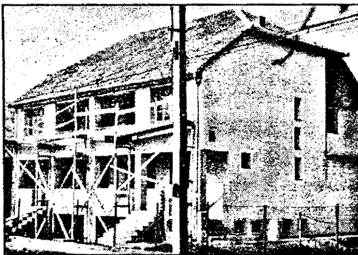
Nu, nu-i biserică, ci o simplă locuință de vameș de pe strada Bradului.

și-a construit casa, pe nume Tarcea Petre, este vameș la Nădlac. Un om modest, al cărui Opel Vectra (AR 02 LPR) subliniază cât de dificil este să fii vameș în ziua de azi”.