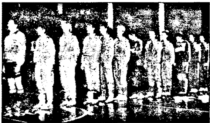
România pregătește la Arad o calificare istorică.