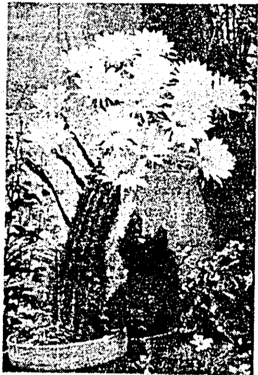
A. In florii cactusul...

S-a constatat că, în emisfera sudică, atunci cînd se găsește o cadă, apa formează un turbion care se orientează aproape întotdeauna în sensul acelor de ceasornic. În schimb, în emisfera nordică, apa se scurge din baie în sens invers. La Equator (ca la Namuki, de exemplu, în Kenya), apa se scurge și într-un sens și celălalt: oricum, nu formează vreun turbion!